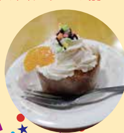
クリスマスケーキを デコレーション