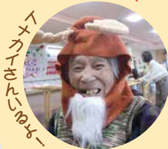
トナカイさんじゆり