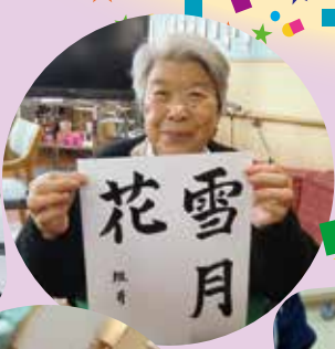
書き初めて 気持ちも ひきまします