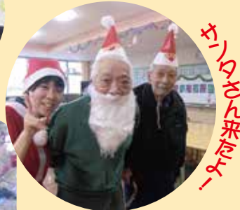
サンタさん来たり