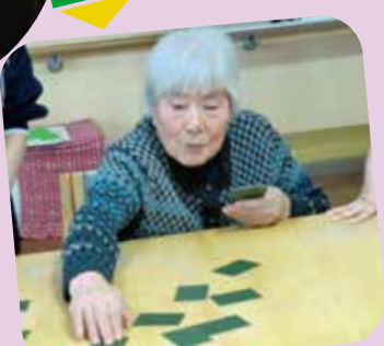
なつかしい坊主めくり