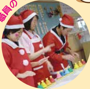
職員のパネル演奏