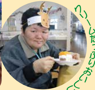
クリスマスケーキ