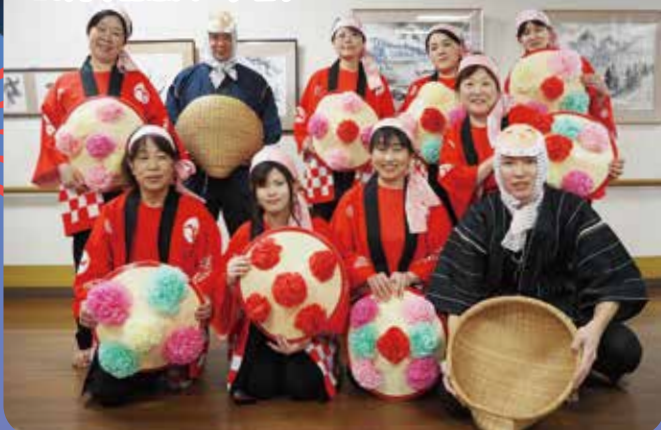
★厨房職員オリジナル「花笠音頭」 20周年記念バージョン